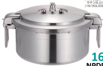
◆本体表面は サテン仕上げ (16/30Lのみ) 16L NPDD16

●プロビッグ4 15L ◇品番:610478 ◇1カートン2台 標準小売価格 ¥155,000(税抜)