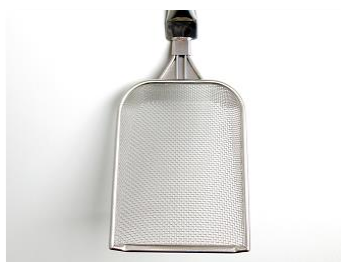
◆ 網部の強度も十分！