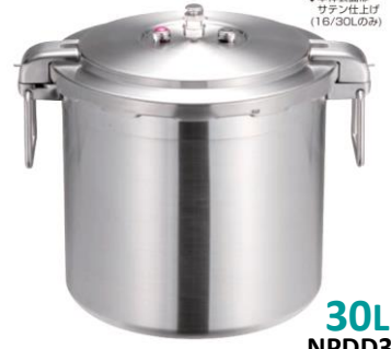
◆本体表面は サテン仕上げ (16/30Lのみ) 30L NPDD30

●プロビッグ4 20L ◇品番:610492 ◇1カートン 2台 標準小売価格 ¥180,000(税抜)