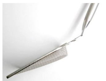
◆ すくい易さを考えた角度設計☆