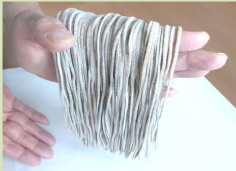
1. ソバに付いた打ち粉を丁寧に落としします