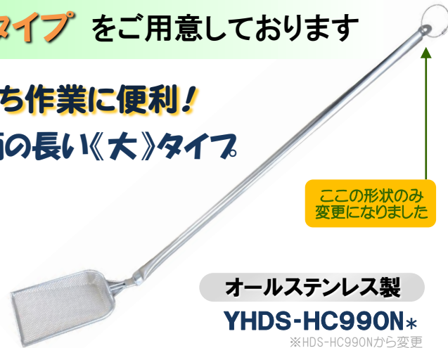
ここ形状のみ変更になりました