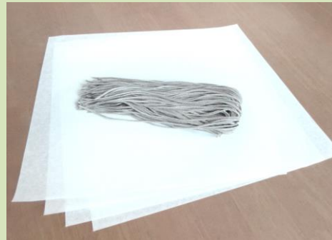
2. 一人前のソバを紙の真ん中に置きます ※ソバがねじれないように置いてください