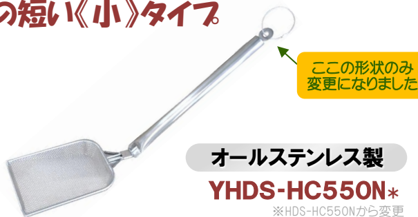
ここ形状のみ変更になりました