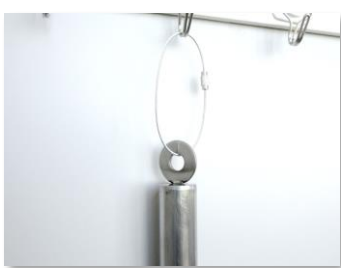
◆ 浮かせて収納でき衛生的！ 引掛け用リング付き